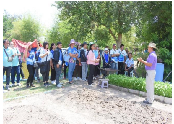
ชมแปลงผักบุ้ง