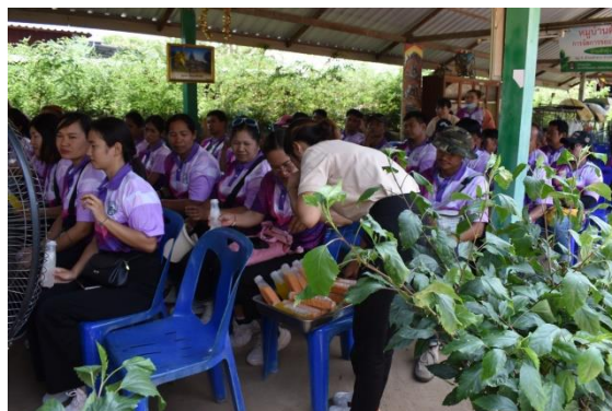
การคัดแยกขยะ