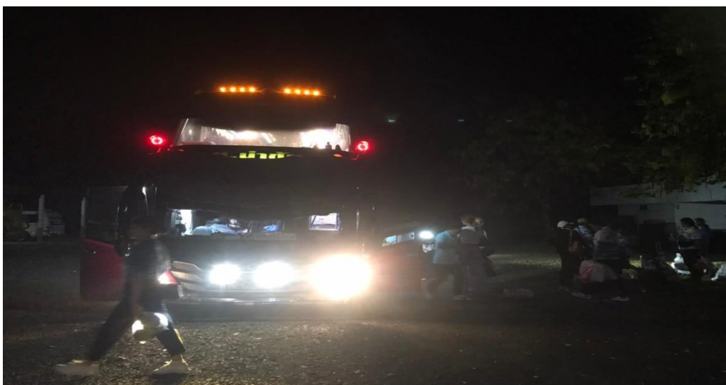
รับประทานอาหารค่ำเสร็จแล้วขึ้นรถเดินทางกลับโดยสวัสดิภาพ