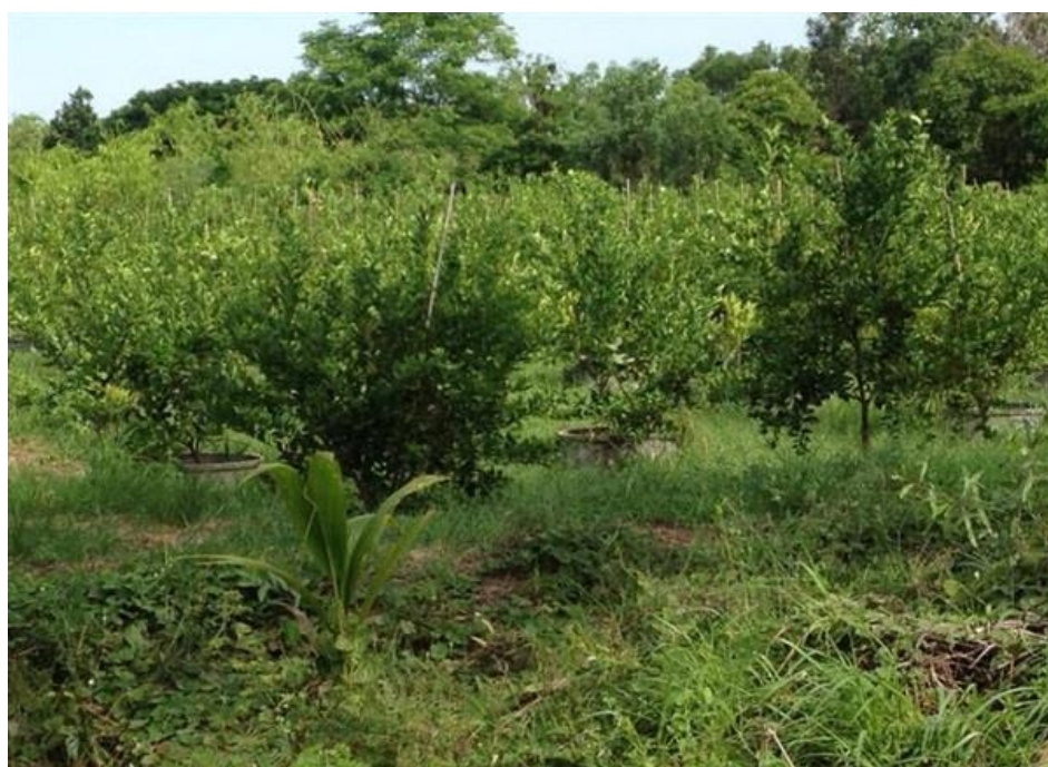
สวนมะนาว