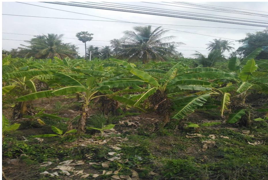
สวนกล้วยหอมทอง

พืชเศรษฐกิจที่สำคัญของ อบต.บ้านในดง ได้แก่ กล้วยหอมทองและมะนาว